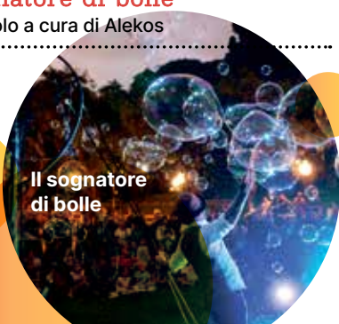
Il sognatore di bolle

☉ • 16:30 Pagoda Il sognatore di bolle spettacolo a cura di Alekos