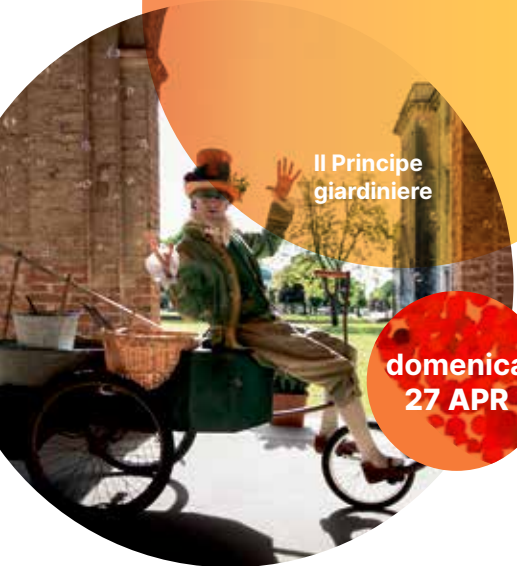
Il Principe giardiniere