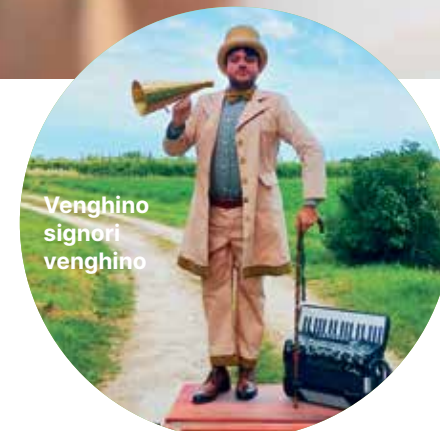
Venghino signori venghino