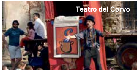
Teatro del Corvo

🕒 11:00 Luna dei bambini Laboratorio dei calzini a cura di Teatro del Corvo