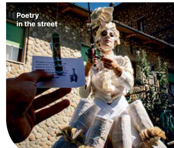
Poetry in the street

🕒 17:00 Zona mercato e parco Animazioni sui trampoli a cura di Poetry in the street